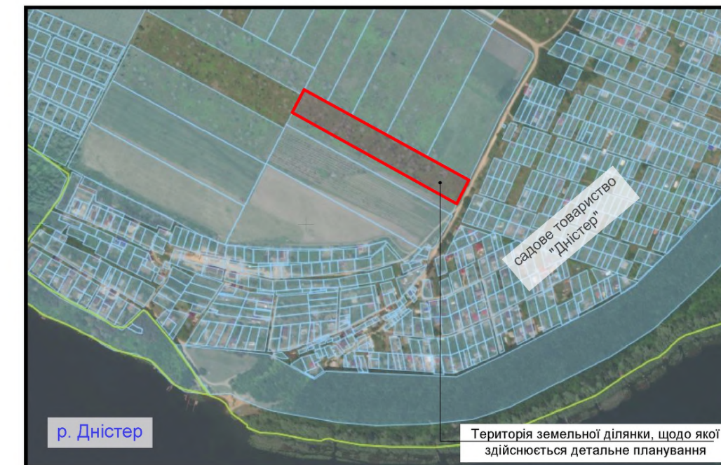
СХЕМА РОЗТАШУВАННЯ ТЕРИТОРІЇ