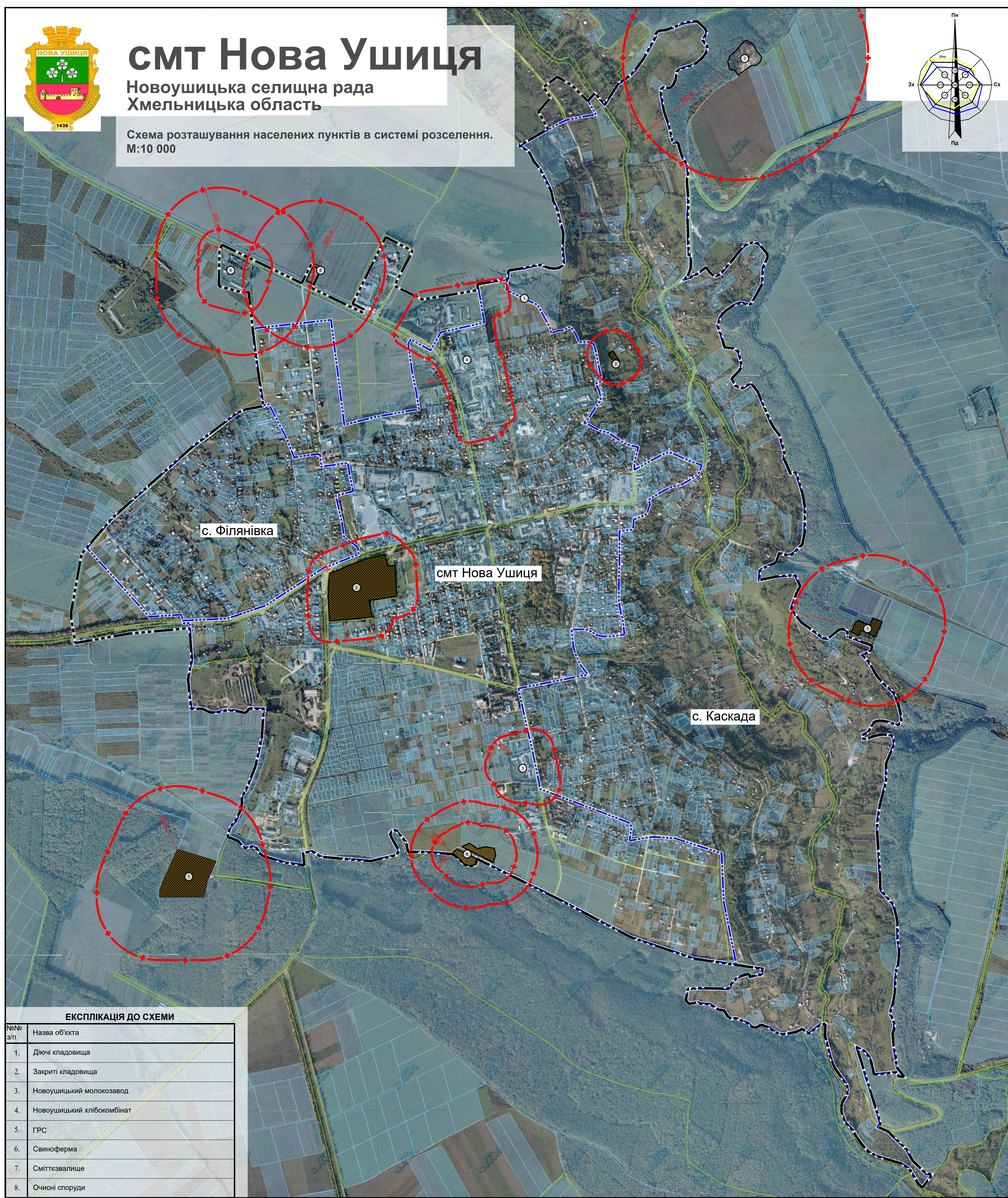
Схема розташування населених пунктів в системі розселення. М:10 000

Новоушицька селищна рада Хмельницька область